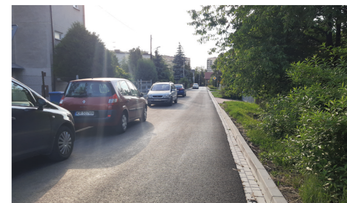
Wyremontowana ul. Pienińska