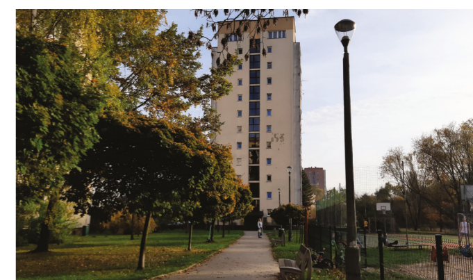
Nowe lampy parkowe na terenie osiedla