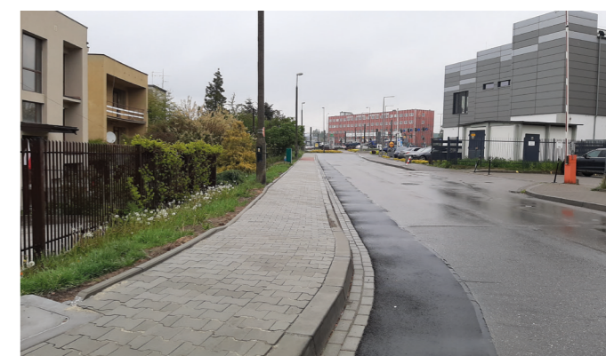
Wyremontowany chodnik ul. Cegielnianej