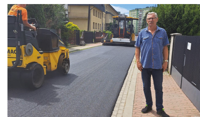
Wyremontowana ul. Koszalińska