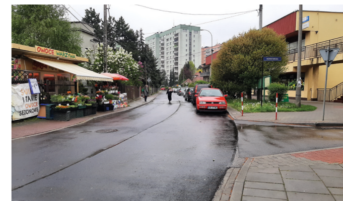
Wyremontowana ul. Kołobrzeska